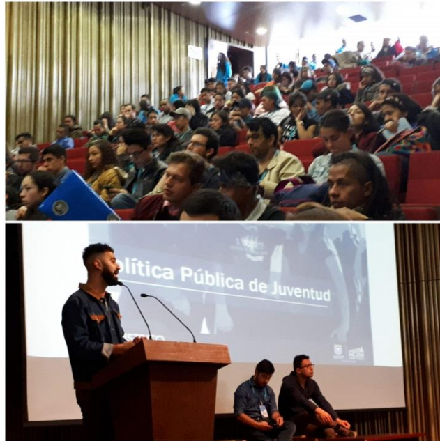
Ilustración 2 Taller de formulación de PPDJ con jóvenes líderes de la ciudad

SECRETARÍA DE GOBIERNO Instituto Distrital de la Participación y Acción Comunal