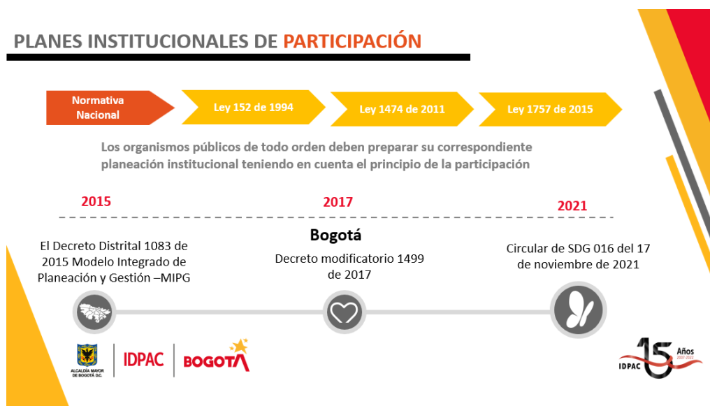
Figura No. 4. Planes Institucionales de Participación