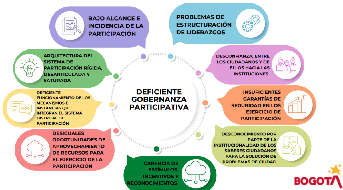
Figura No. 1. Deficiente gobernanza