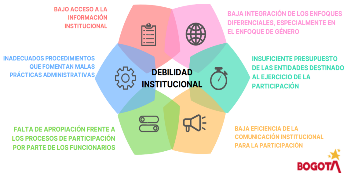
Figura No. 2. Debilidad Institucional